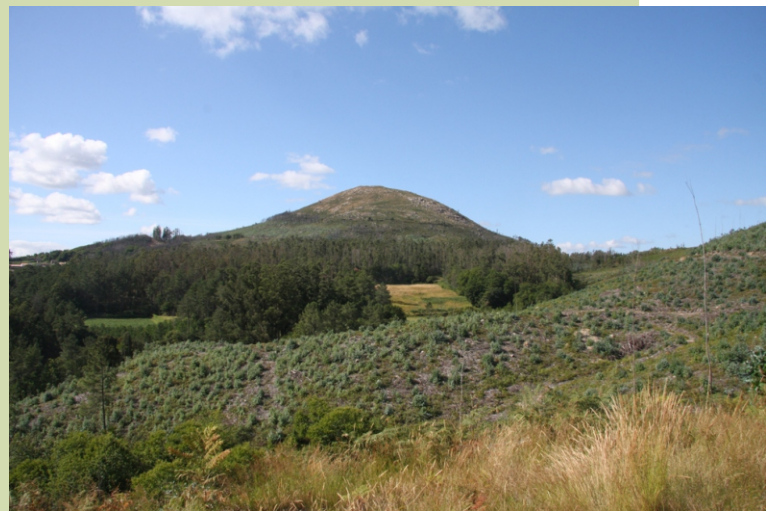
Coto da Cabana, o de máis ao sur dos montes do Oleirón