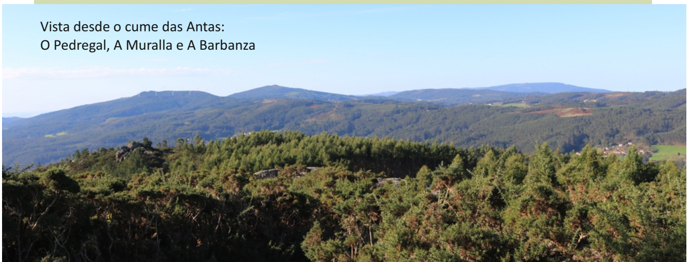
Vista desde o cume das Antas: O Pedregal, A Muralla e A Barbanza