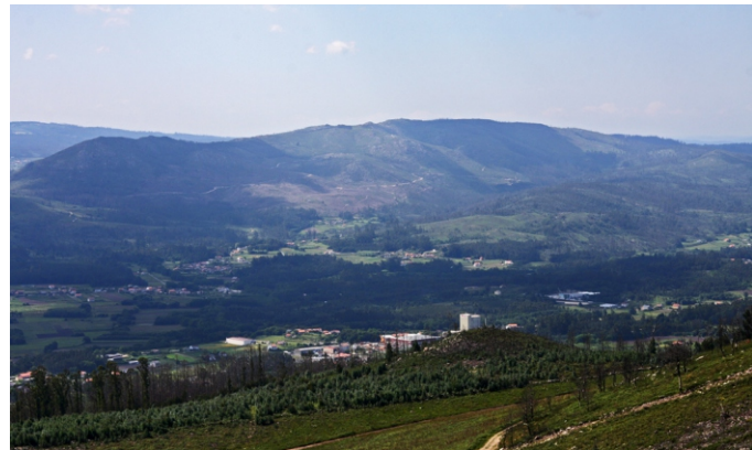
Vista xeral da aba leste dos Montes do Oleirón

Non é un sitio para ir moi cedo porque a posición do sol, no leste, interfere nas vistas.