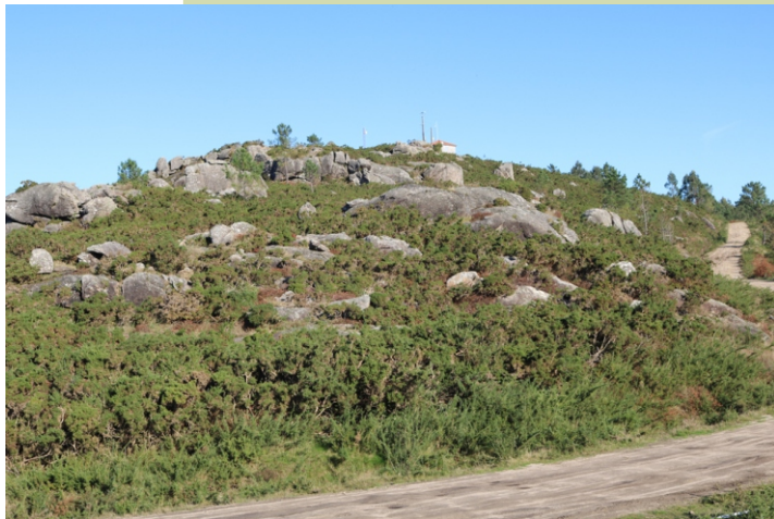
Cume das Antas