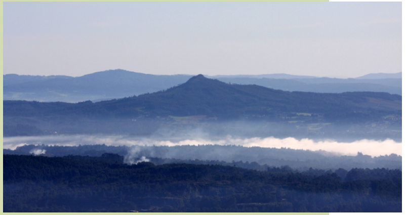
Vista cara ao Pico Sacro desde o Oleirón