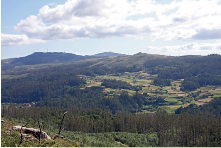
Val do río Sarela de Brión. Ao fondo O Pedregal e a Muralla