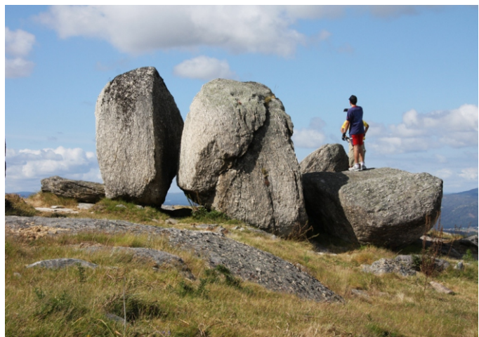
Rochas no punto panorámico ao pé de Santa Cecilia.