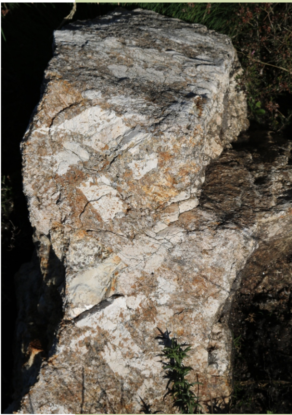
Pegmatita con grandes cristais de feldespato