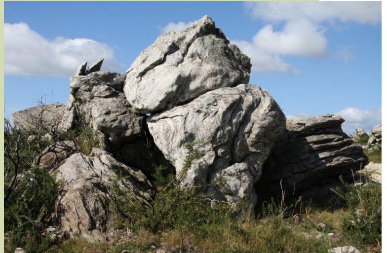
Rochas no Cravadoiro