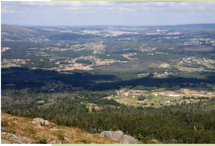
Val do Sar e, ao fondo, Santiago